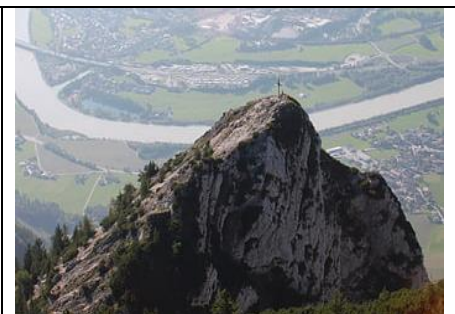
Naunspitze hoch überm Inntal