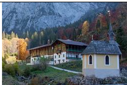
Anton-Karg-Haus mit Kapelle in Hinterbärenbad

ich möchte mit euch gemeinsam 4 besondere Wandertage vom MI-19. bis SO-23.07.2023 im Kaisergebirge bei Kufstein verbringen. 3 urige Hüttenübernachtungen ( Weinbergerhaus , Stripsenjochhaus und Vorderkaiserfeldenhütte ) erwarten uns.