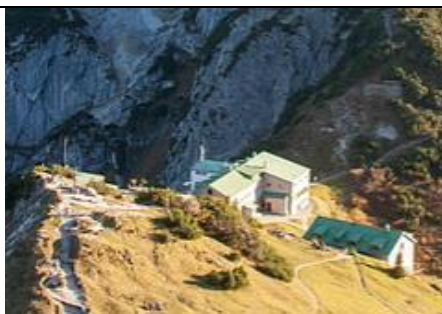
Stripsenjochhaus mit Kaisernordwänden