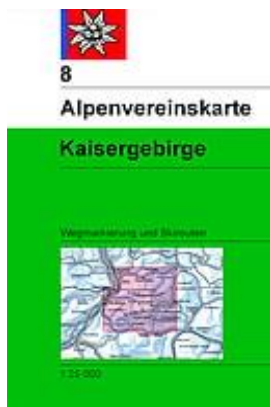
Alpenvereinskarte 8 "Kaisergebirge"