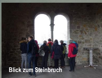
Blick zum Steinbruch