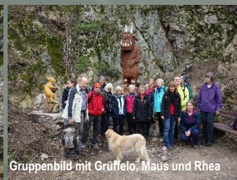
Gruppenbild mit Grüffelo, Maus und Rhea