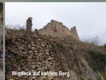
Windeck auf kahlem Berg